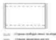
Рисунок 6.1 – Схема закрепления платы

На рисунке 6.1 приведена схема закрепления платы.