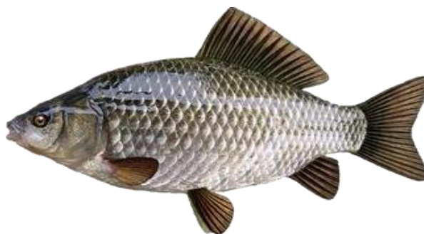
Рисунок 2 – Серебряный карась

«... в качестве добавочной рыбы на хозяйстве используется серебряный карась (рис. 2)».