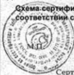
Схема сертификации 3. Все виды разделки, условия хранения и сроки годности в соответствии с ТУ 9263-113-00472093-2002. Знак соответствия указан на этикетке.